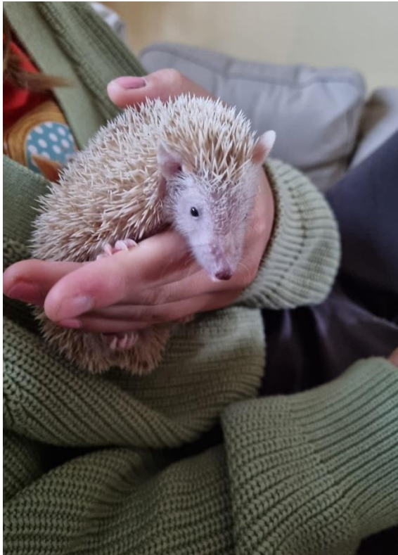
Bijzonder bezoek in klas 1a