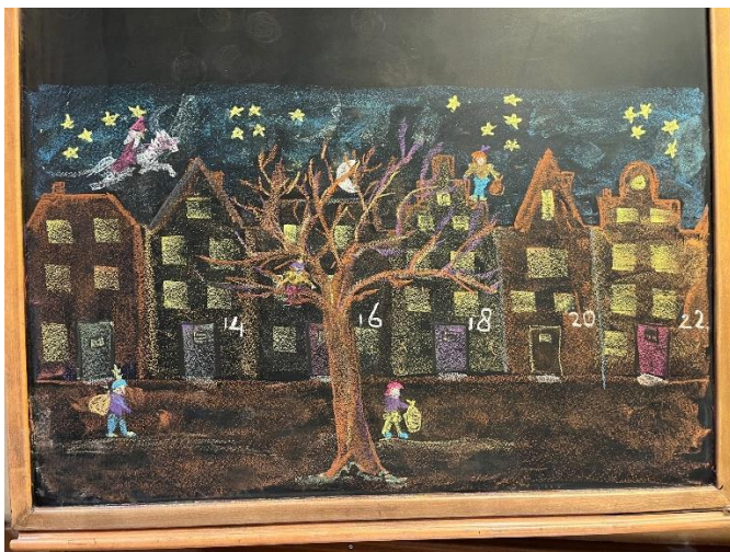
Bordtekening klas 1b