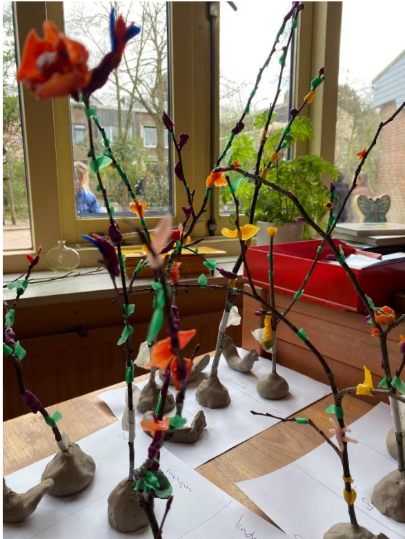
Heemkunde klas 1a